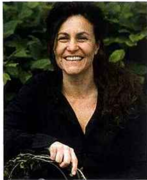
Par Isabelle Chabeur, styliste, créatrice.