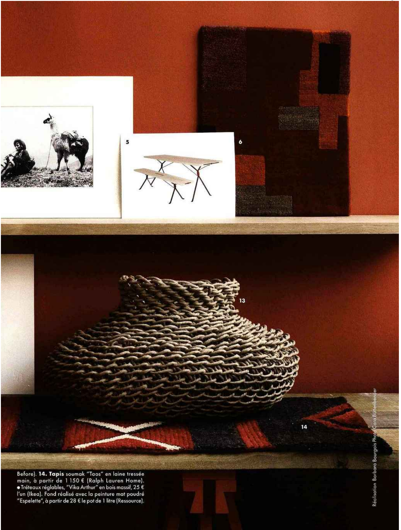
Before). 14. Tapis soumak "Taos" en laine tressée main, à partir de 1 150 € (Ralph Lauren Home). ● Tréteaux réglables, "Vika Arthur" en bois massif, 25 € l'un (Ikea). Fond réalisé avec la peinture mat poudré "Espelette", à partir de 28 € le pot de 1 litre (Ressource).

Réalisation: Barbara Bourgois